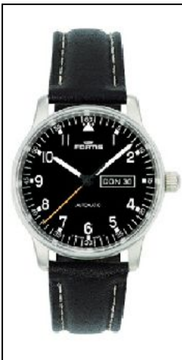
Fortis Pilot Professional Day Date